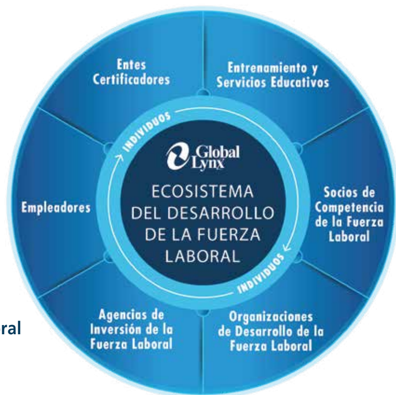
Ecosistema de Desarrollo de la Fuerza Laboral

Son las organizaciones que proveerán el capital para capacitar a los individuos.